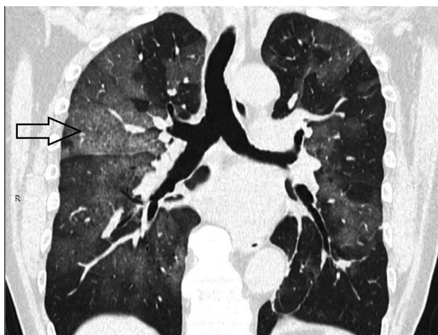
Рисунок 2 МСКТ органів грудної клітки пацієнта 3. у коронарній площині. Стрілкою вказані ділянки ураження легеневої паренхіми («paving stone»)

Рисунок 1 МСКТ органів грудної клітки пацієнта 3. в аксіальній площині. Стрілкою вказані ділянки патологічного ураження легеневої паренхіми у вигляді «матового скла»