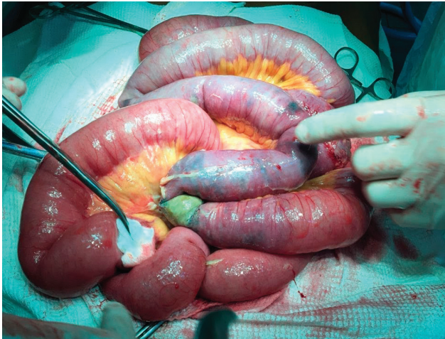
Рис. 1. Ділянка гангренозно зміненого тонкого кишечника пацієнтки А.

Після короткої передопераційної підготовки в умовах відділення хірургічної реанімації хвора в ургентному порядку прооперована. Інтраопераційно: в черевній порожнині незначна кількість (300 мл) серозного випоту. Петлі проксимального відділу тонкого кишечника роздуті до 4 см у діаметрі. На відстані 130 см від зв'язки Трейца — ділянка гангренозно зміненої тонкої кишки протяжністю до 120 см (рис. 1). Артерії брижі ураженого сегмента не пульсують. Пульсація основного стовбура верхньої брижової артерії збережена. Дистально відділ здорового тонкого кишечника розміщений на відстані 40 см від ілеоцекального кута. Виконано резекцію гангренозно зміненої та ішемізованої ділянки тонкого кишечника. Загальна довжина видаленої ділянки — 160 см, що у цієї пацієнтки відповідає половині загальної довжини тонкого кишечника. Враховуючи високий ризик неспроможності первинного анастомозу, проксимальний та дистальний відділ кишки фіксовано між собою та виведено у правій клубовій ділянці у вигляді двостволки.